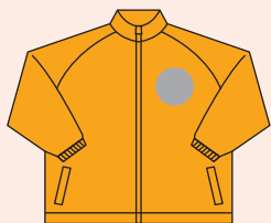
前面左胸(ワンポイント)